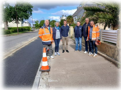
Rue de l'Aviation l'entreprise COLAS a effectué la suppression des purges avec un renforcement des sous-sols et la pose de trottoirs.