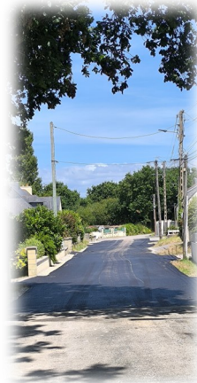
Rue du Navarrou le renouvellement des canalisations a été effectué. La chaussée a été entièrement refaite par la COLAS jusqu'à la limite des entrées des particuliers.