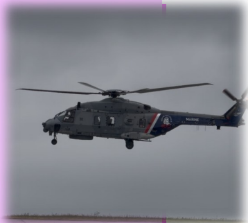
1 er vol du Caïman Marine arborant la livrée bleue inédite des 400 ans

La fête de la mer, le 13 juillet, sera aussi l'occasion de découvrir cette livrée : la BAN sera heureuse d'être présente aux fêtes de la mer au travers d'une démonstration de sauvetage organisée en partenariat avec la Société nationale de sauvetage en mer.