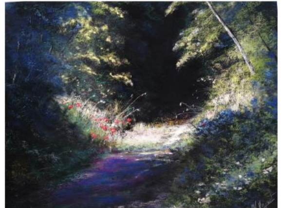
« Lumières » de Jean-Noël MAGUET—prix du public 2020

Entrée gratuite—dans le respect des gestes barrières