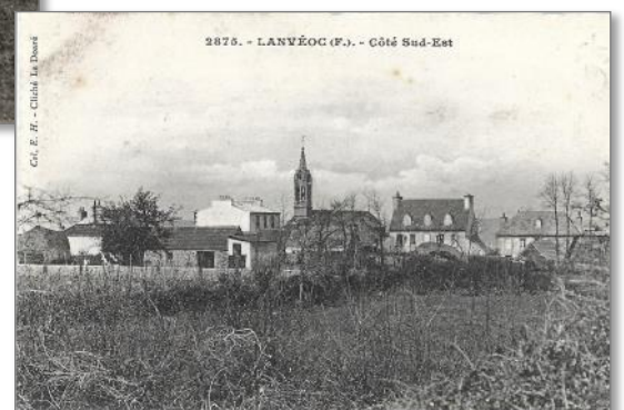
Vue de la partie sud-est de la commune