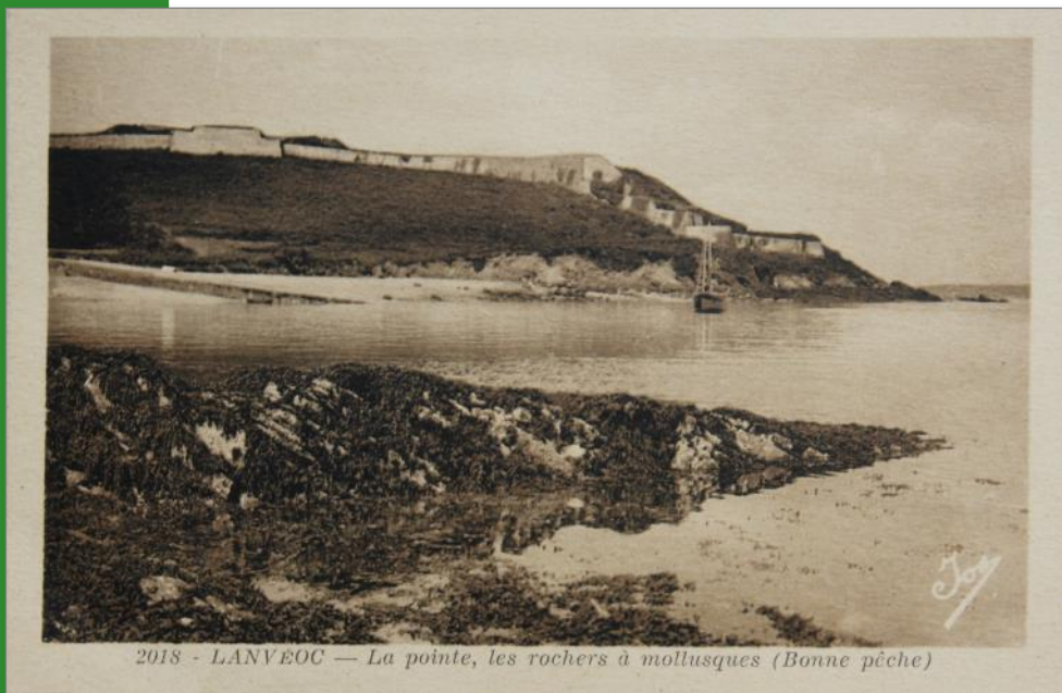
2018 - LANVÉOC — La pointe, les rochers à mollusques (Bonne pêche)