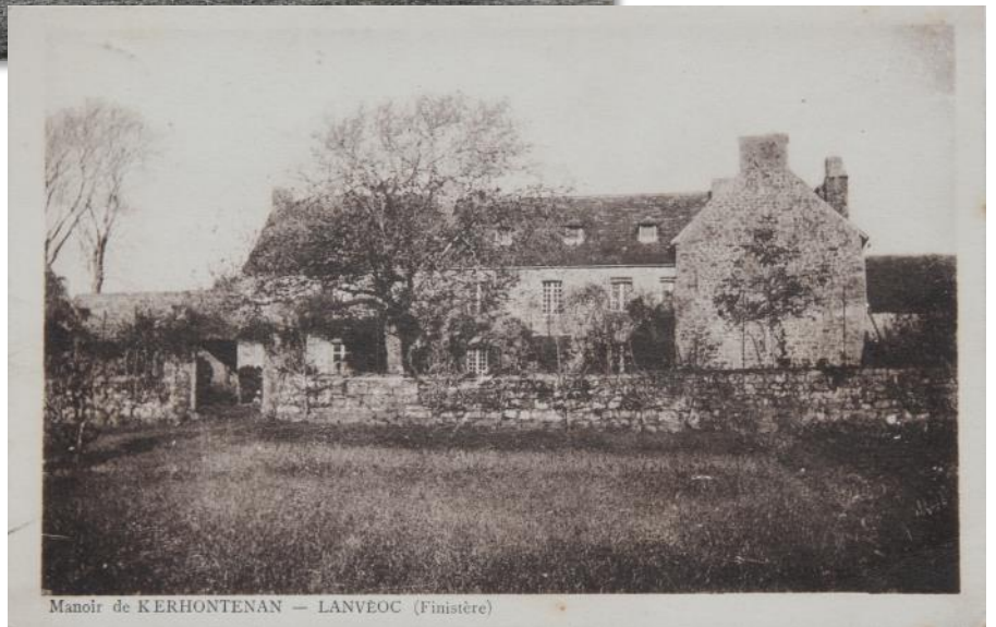
Manoir de KERHONTENAN — LANVÉOC (Finistère)