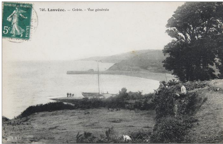
Vue de la Cale prise sur les terrains de l'actuel camping