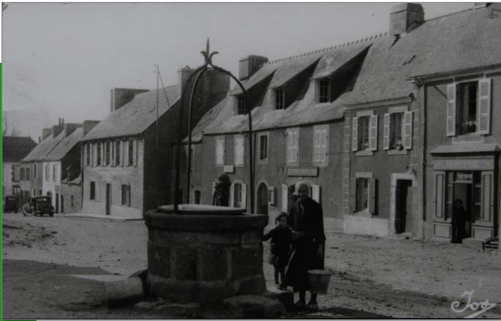
Rue de la mairie. En 1922, ouverture d'une deuxième classe de garçons, la mairie est transférée dans la même maison que la boucherie