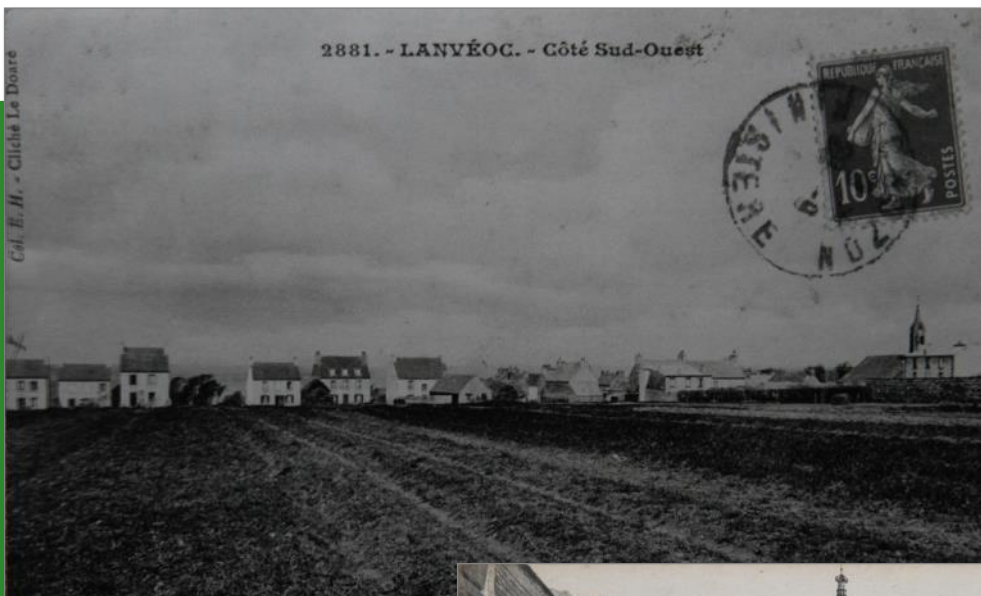
Vue de la partie sud-ouest de la commune