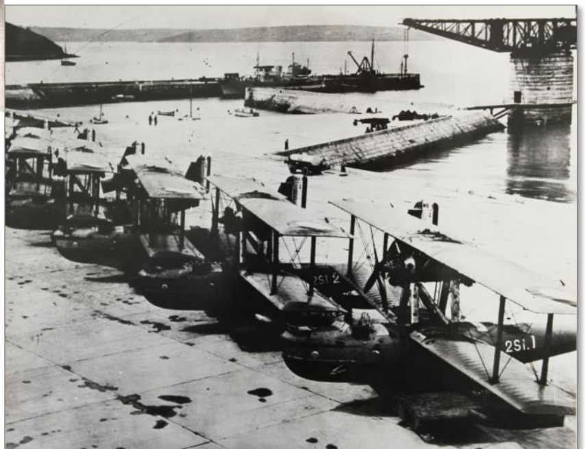
Hydravions sur l'hydrobase du Poulmic 1937