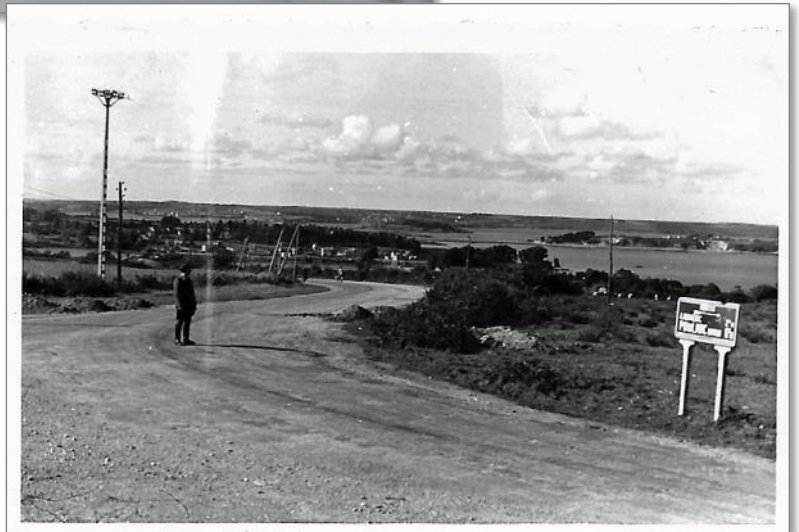
Sortie vers le Fret au niveau de l'actuel rond-point du poteau