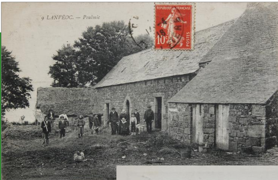
La ferme du Poulmic