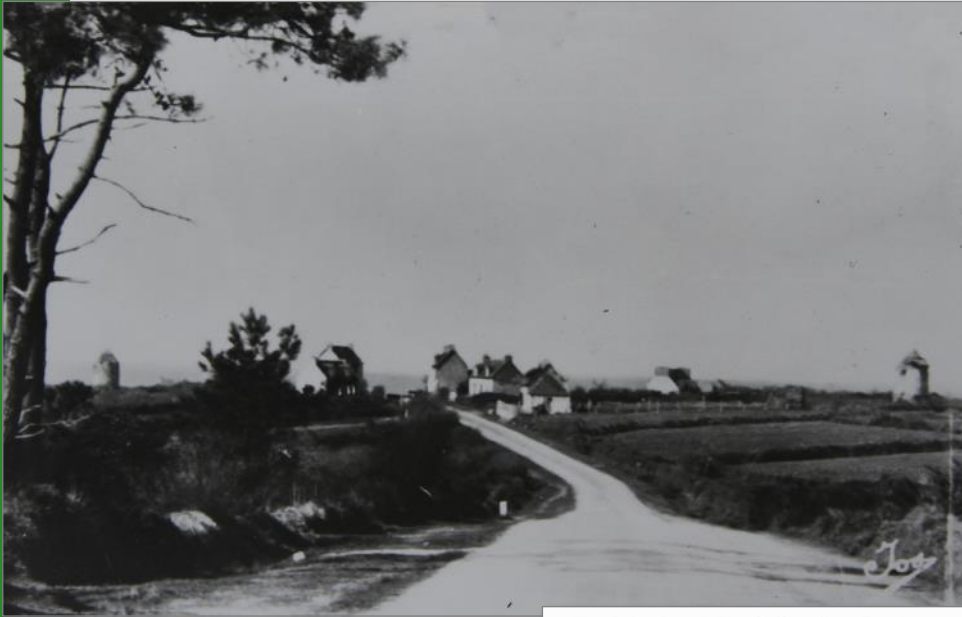
Entrée par la rue de Tal-Ar-Groas