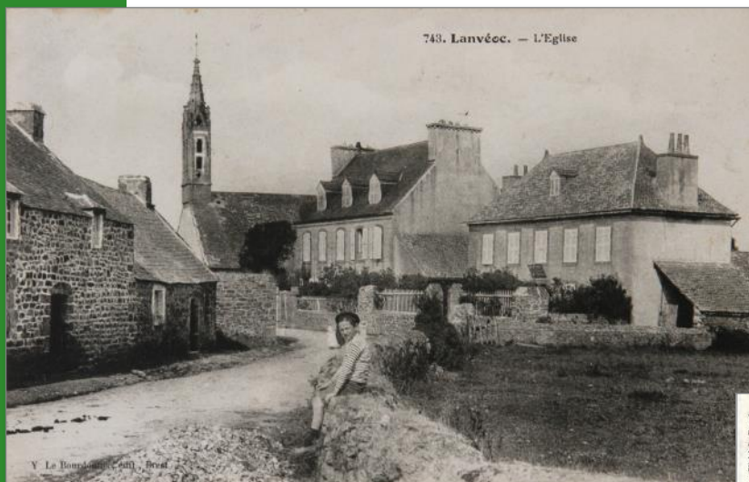
Actuellement rue du Poulmic