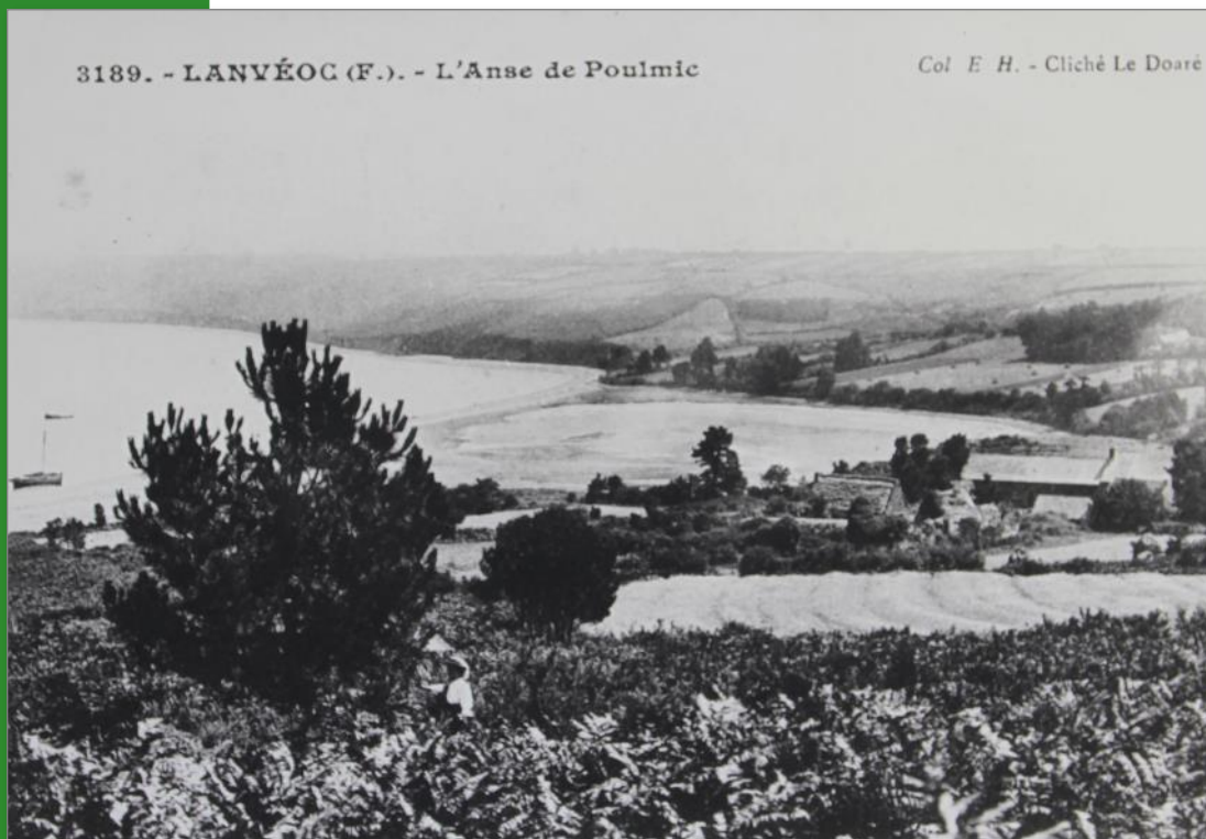
Anse du Poulmic avant travaux de l'hydrobase

La Commune passe de 1255 habitants à 1038 entre 1911 et 1931.