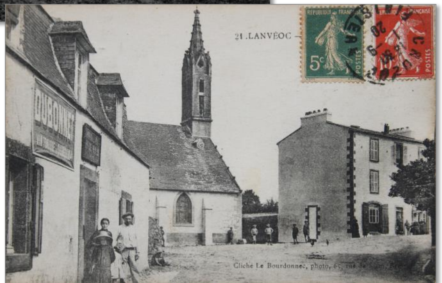
Place de l'Eglise