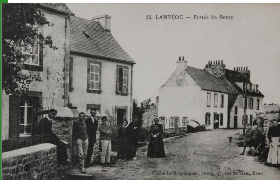
Entrée du Bourg, rue du Fret